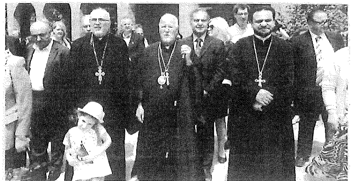
المتروبوليت صليبا وكهنة والبروفسور الحاج